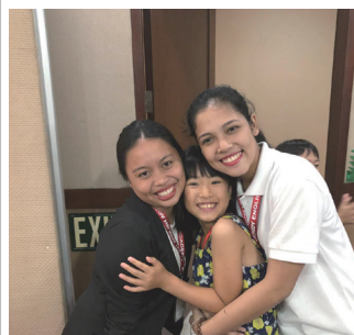
先生たちとも仲良くなった♡