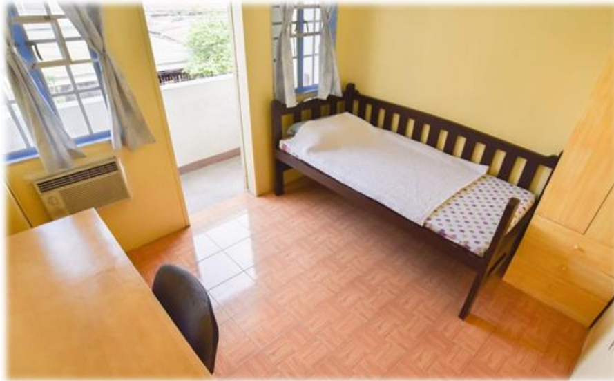
当校の2階寮のお部屋です。

セブスタディは、学生全員に個人室を提供しています。少なくとも2人以上が一緒に生活する他の学校とは完全に各が異なる快適さを提供し、より集中的な