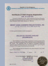
TESDA Permit (Basic ~ Advance)