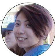
MEI / 女性・台湾