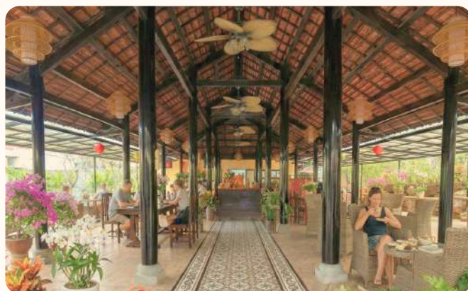
Wellness Dining & Cafe