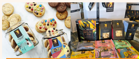
Byron Bay Cookie Company