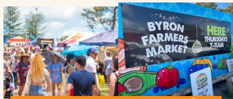
Byron Bay Farmers Market