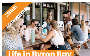
Life in Byron Bay