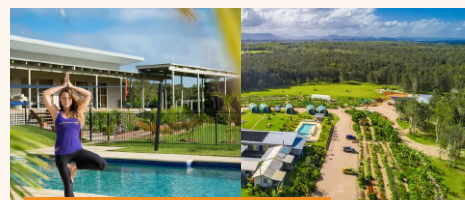
Byron Yoga Centre