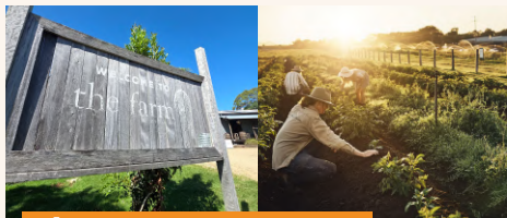
The Farm Byron Bay