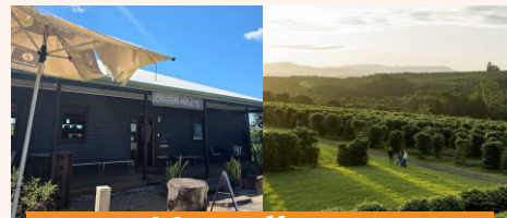
Zentveld's Coffee Roastery

農業・飲食・教育が一体となり、ブランドとして設計された空間で価値を生み出すモデル