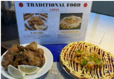
伝統食の日&フルーツの日 (週1回)