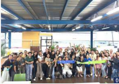
ソーシャルイベント (月2回)