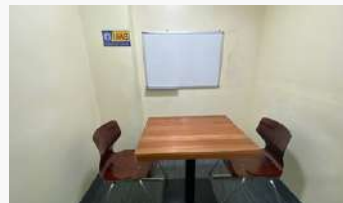
マンツーマンクラス