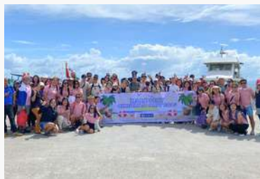
クリスマスパーティ