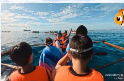
evacademy La Mer