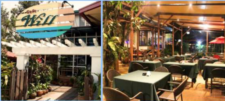
Cafe Will 営業時間 8:30am~1:30am 11 M.H. Del Pilar St, Brgy. Burnham - Legarda, Baguio, 2600 Benguet