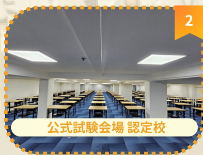
2 公式試験会場 認定校