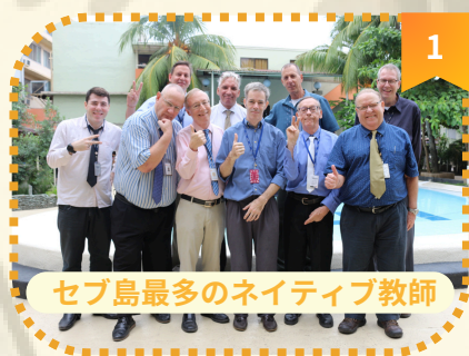
1 セブ島最多のネイティブ教師