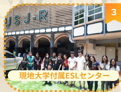
3 現地大学付属ESLセンター