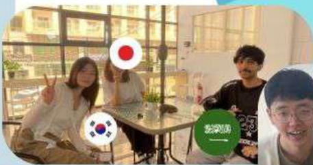
ラウンジでお話し

3月の生徒さんの国籍は韓国が7割、続いてサウジ、台湾、韓国、日本が多いです。韓国は家族が留学の生ささんお一人様国籍ハンスが良いです。