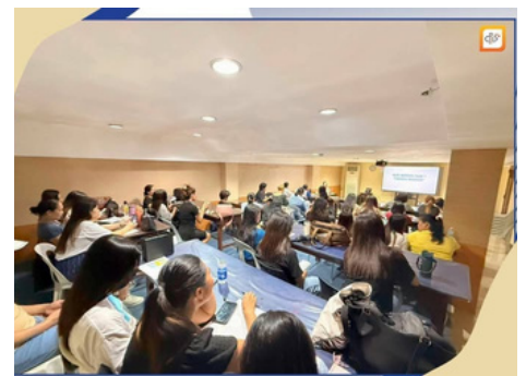
教師トレーニングの様子

これからのTOEFLコースでは、新形式に対応したレッスンを受講していただけますので、ぜひお客様へご案内くださいませ。