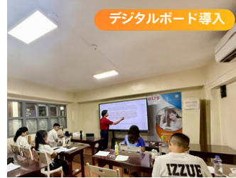
デジタルボード導入

一部の教室ではデジタルボードを導入し、学生の理解度向上・効率的な授業の提供を進めています。