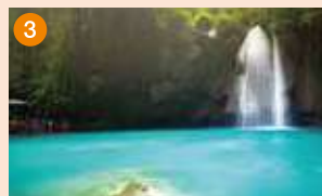
カワサン滝 透明度が抜群で青色を保つ滝壺！