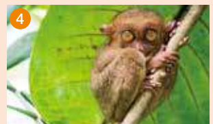
ボホール島 ボホール島「ターシャ」との出会い！