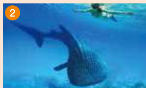
オスロブ ジンベエザメとシュノーケリング！