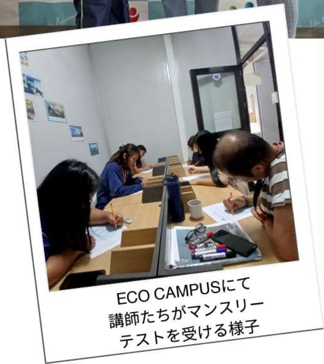
ECO CAMPUSにて講師たちがマンスリーテストを受ける様子

生徒は1週間の終わりに教師の評価表（12項目5段階）を提出します。その評価はマンスリーテストの結果、就業態度とともにマンスリー評価につながります。項目例：先生は授業準備はしっかりしていますか？