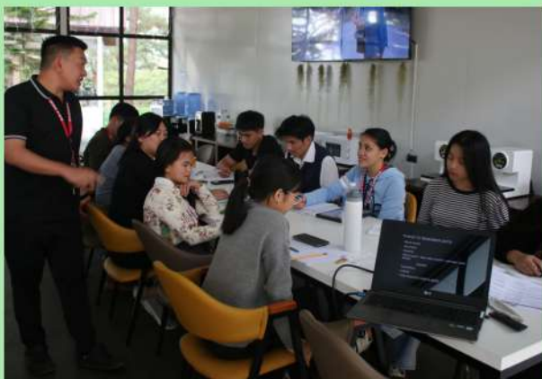
▲ECO CAMPUSで行われたIELTS講師育成トレーニングの様子

IELTS・TOEIC・TOEFLといった試験の特性や指導法を体系的に学びます。その後、当校の模擬試験を実際に受験し、一定のスコアを取得できた講師のみがテストコースを担当可能となります。