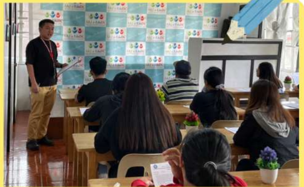
▲以前行われた新人講師向けIntensive トレーニングの様子

ESL指導に必要な基礎スキルを徹底的に身につけるプログラムです。授業の組み立て方や教材の活用法、理解度を高める説明の工夫など、講師としての基盤を固めていきます。さらに、生徒の学習意欲を引き出すフィードバックの方法や、信頼関係を築くためのコミュニケーションスキルも重点的に強化します。初期段階でこれらを習得することで、講師は自信を持って授業を行い、安定した学習環境を提供できるようになります。