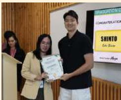
Shinto さん(22歳) General ESLコース