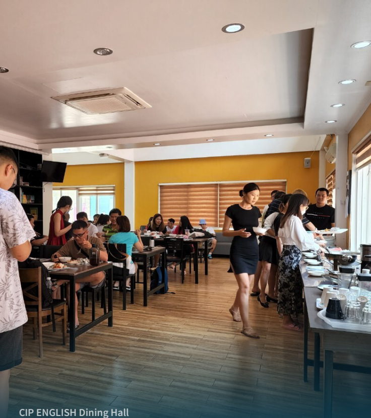
CIP ENGLISH Dining Hall