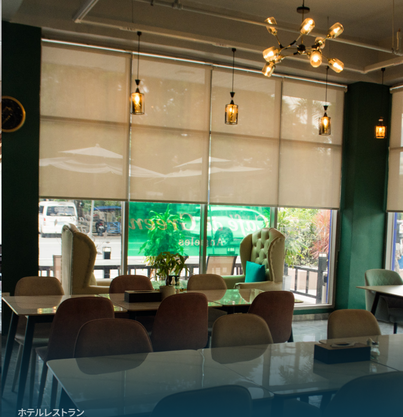
ホテルレストラン