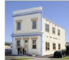
Thames campus チームズ キャンパス