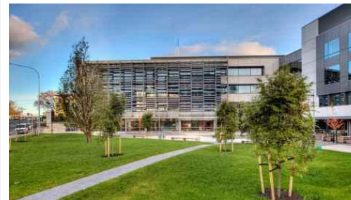
The University of Auckland