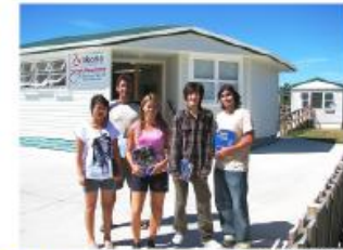
Whitianga campus フィティアンガ キャンパス