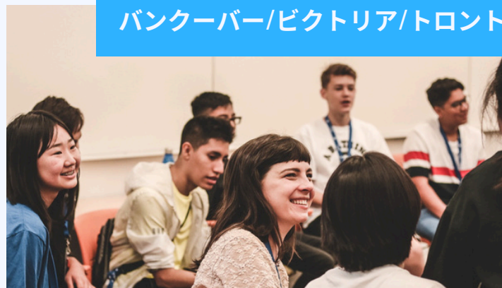
バンクーバー/ビクトリア/トロント