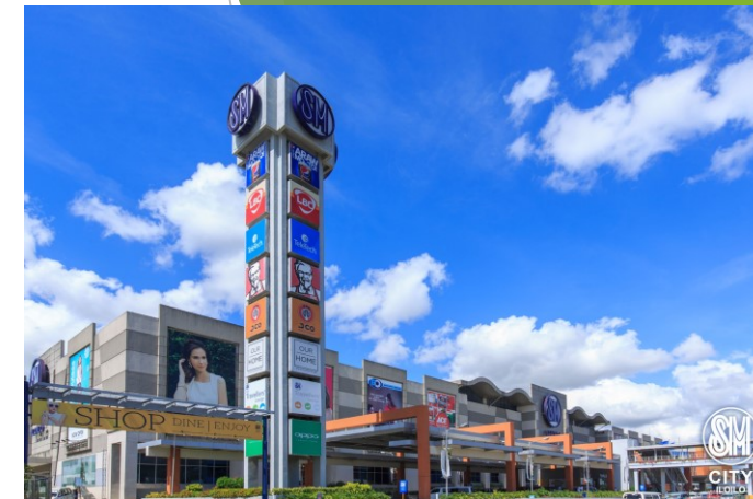
SM City ※徒歩 15 分圏内