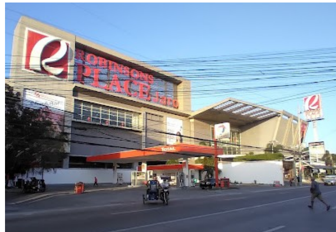
Robinsone Place ※徒歩 5 分圏内