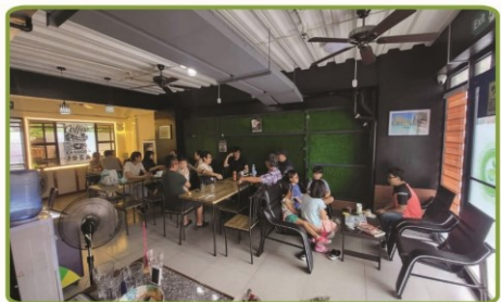
CAFETERIA & STUDY SPACES