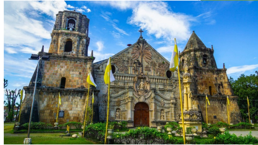
ミアガオ教会 世界遺産