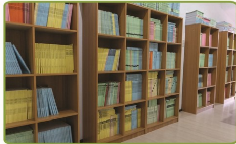
LEARNING RESOURCE AREA