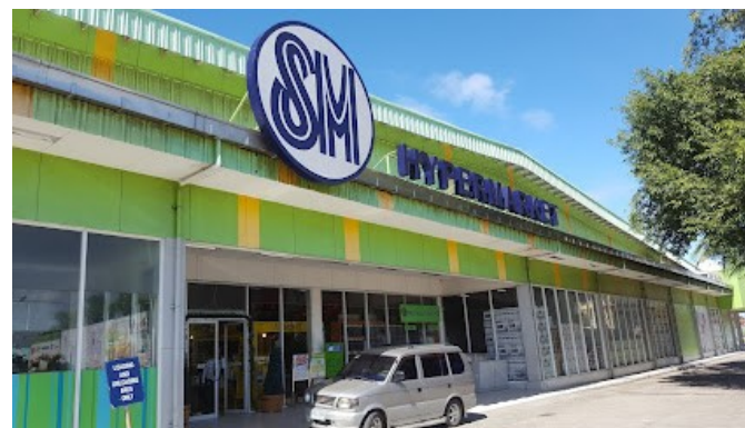
SM Hypermarket ※徒歩 5 分圏内